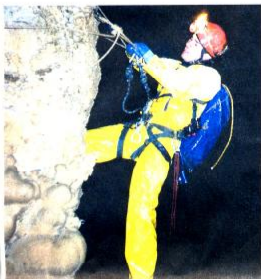
Les spéléologues ont effectué diverses démonstrations dans la cité du chapeau.

Rassemblement inter-régional pour les passionnés de grottes et de grands fonds.