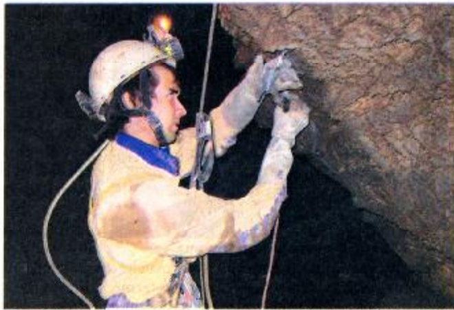
La spéléo, tout un art de découverte qui allie la culture, parfois la science, mais aussi le sport.

En Tarn-et-Garonne, ces deux journées prennent un caractère un peu particulier. En effet, deux week-ends précédents ont vu se dérouler diverses manifestations qui ont accueilli des stands consacrés à la spéléologie et sur lesquels les spéléologues ont pu réaliser la promotion de leurs activités, notamment à l'occasion de la Fête des sports, à Caussade ; à « Vitalsport » ; à Montauban et à la Fête des vendanges, à Bruniquel. Aussi, les responsables de clubs et les amateurs éclairés ou potentiels ont-ils pu se contacter