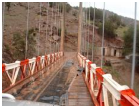
Pittoresque la route !