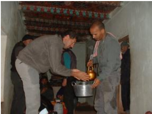
L'hospitalité n'est pas un vain mot dans les montagnes Marocaine

Après un arrêt chez l'habitant ou nous sommes accueillis comme si on se connaissait depuis des années , nous prenons la décision de faire demi-tour et de filer vers le désert , au moins là il ne devrait pas pleuvoir .