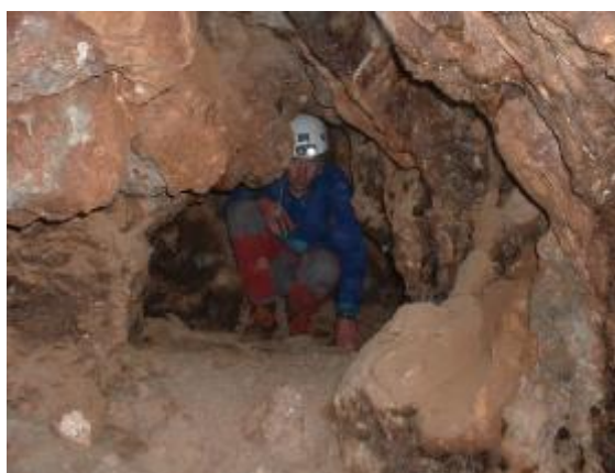
Porche dans la falaise – gorges d'arrous