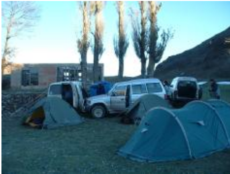
Bivouac au contact de la partie granitique et calcaire du Haut Atlas

Les quatre derniers jours seront consacrés à la visite des gorges de la Todra et du Dadès, plus dans un but touristique que spéléologique car le terrain ne se prête pas vraiment à de grosses découvertes . le périple se termine , nous avons parcouru trois mille kilomètres dans le Maroc et il nous faut rentrer à Casa ou l'avion nous attend.