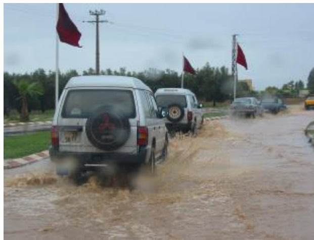
Retour vers Casa