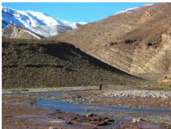
Vallée d'afflafal à deux jours de marche depuis El Had