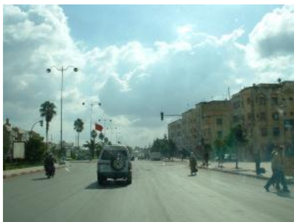
Départ de Casa vers El Had