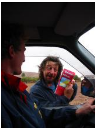
C'est par ou le désert ?