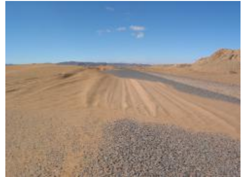
Merzouga , la route est longue