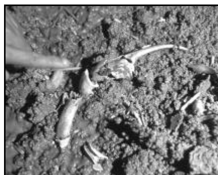
Un crabe océanique dans les supérieurs de Don Pancho