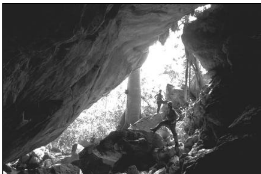
La perte de Sajanean