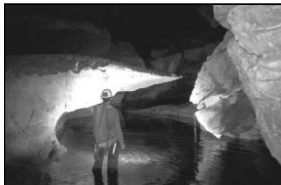
La rivière de Sajanean