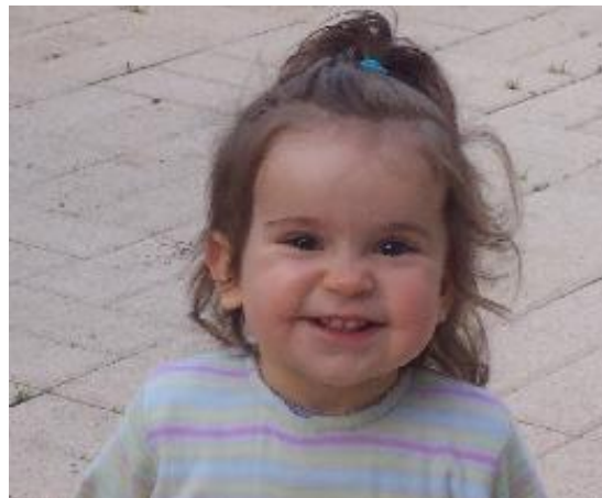
La plus jeune participante

Il est à souligner que cette manifestation a été possible grâce à l'implication bénévole de spéléologues de la région Midi-Pyrénées, ceci tant pour l'organisation que pour l'encadrement de ce week-end.