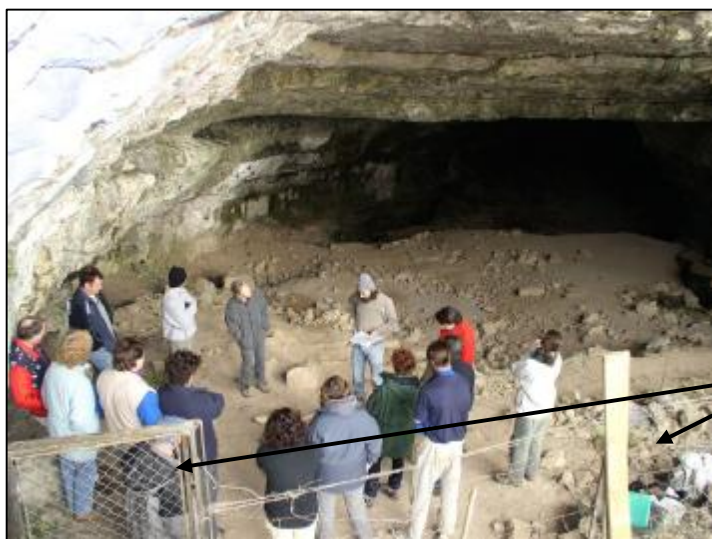
Aperçu sur le site des divers grillages

Il reste à ce jour notamment un grillage, des fils barbelés, une grille (porte), ... en très mauvais état.