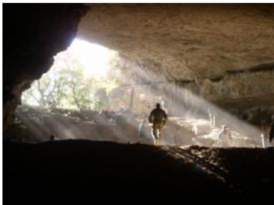
Le porche d'entrée de la grotte vu de l'intérieur

Grotte de la Pyramide Commune de Penne - Tarn Région naturelle : Causse d'Anglars