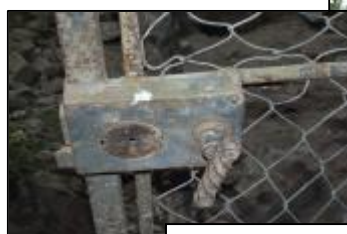
La porte et la serrure