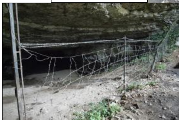
Le porche d'entrée avec le grillage actuel