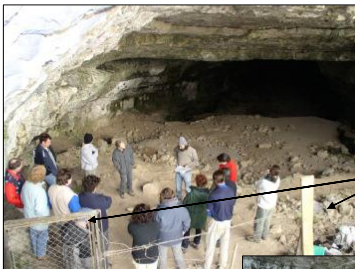
Aperçu sur le site des divers grillages