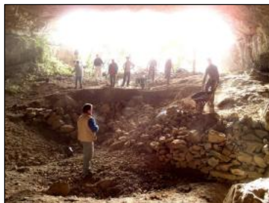
Photo du site suite à l'action de mise en protection

Le bilan de cette journée a été positif pour tout le monde. C'est alors que nous avons convenus d'un prochain rendez-vous pour nettoyer la cavité de la clôture obsolète qui n'avait d'autre rôle que de dénaturer le site.