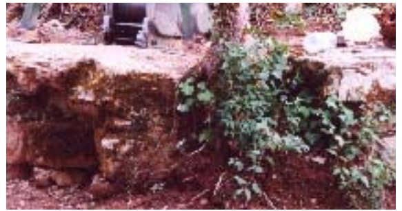
Strates manquantes en surface

L'éboulis est maintenant composé de gros blocs de pierres de 300 kg environ correspondant aux strates manquantes en surface.