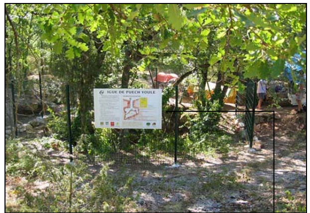
Abords de l'igüe août 2004