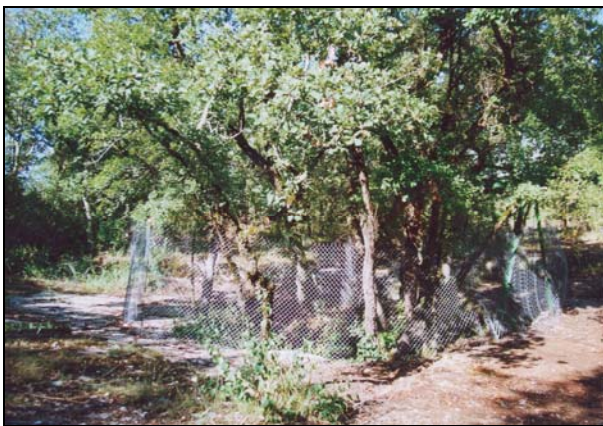
Abords de l'igüe de 2000 à fin 2003

Un panneau d'information a également été réalisé et accroché à la clôture afin d'informer le grand public sur l'action menée sur ce site.