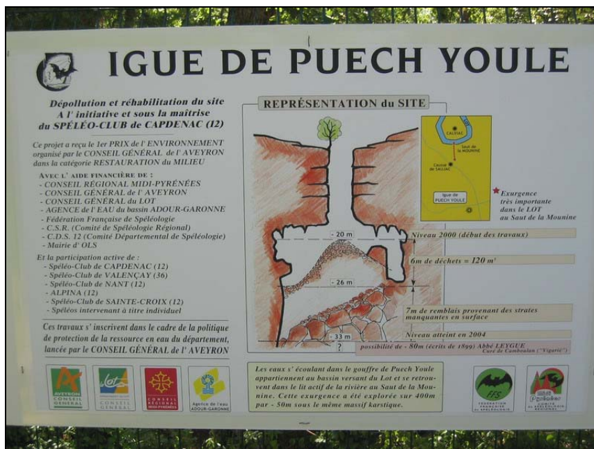
Le panneau d'information