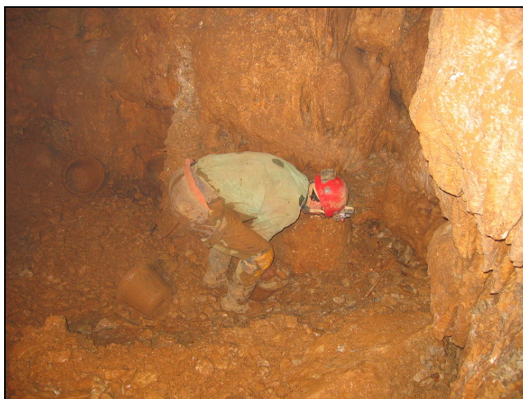
Spéléologue au fond du gouffre de Puech Youle en plein travail

Pour 99 heures de travail de début 2003 à juillet 2004 et 324 heures depuis l'année 2000