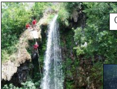
Cascade de Salles La Source