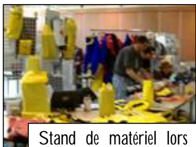
Stand de matériel lors du rassemblement 2006 à Caussade

En outre, nous proposons à l'ensemble de ces partenaires de tenir ou mettre en place un stand ou une exposition lors de ce congrès.