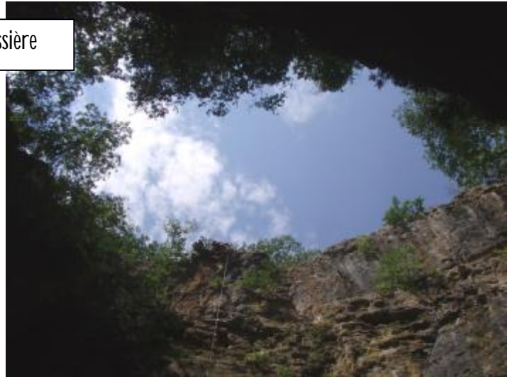
Le Tindoul de la Vayssière

Ü C'est pourquoi nous proposons aux participants spéléologues de visiter des sites spéléologiques majeurs du département qui se trouvent à proximité de Bezannes, site central de notre rassemblement.