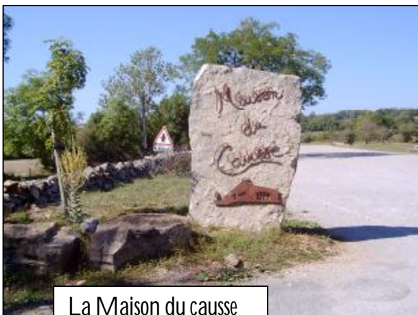
La Maison du causse à Bezannes

Ce site comprend l'équipement nécessaire à l'accueil de plusieurs centaines de personnes : une salle des fêtes de 360 m 2 , des sanitaires, une cuisine, une scène, une galerie d'exposition.