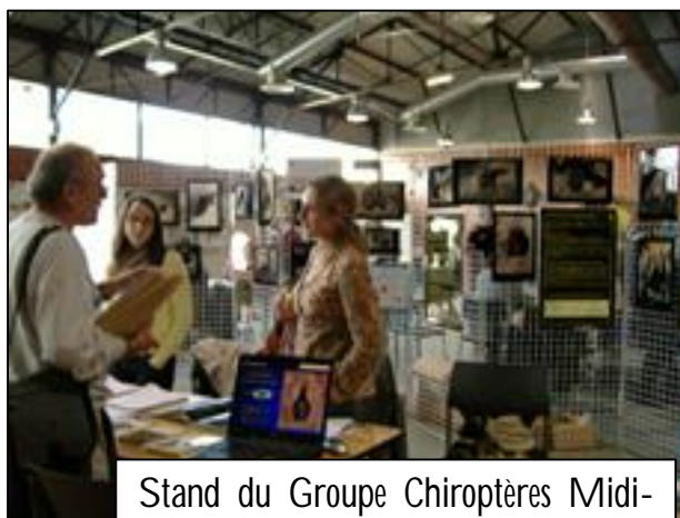
Stand du Groupe Chiroptères Midi-Pyrénées lors du rassemblement 2006 à Caussade