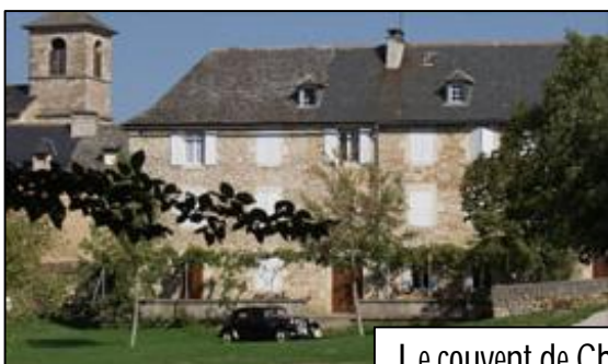
Le couvent de Chantemerle

Situé à 500 mètres de la Maison du Causse, il permet d'accueillir 37 personnes en chambres de 2 à 4 places, avec sanitaires. Il est également possible si nécessaire de disposer de 2 salles de réunion.